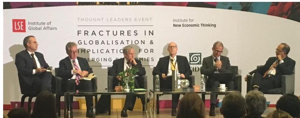
全球化裂痕及对新兴经济体的影响, a Thought Leaders Event, Mexico City, Mexico, June 2017