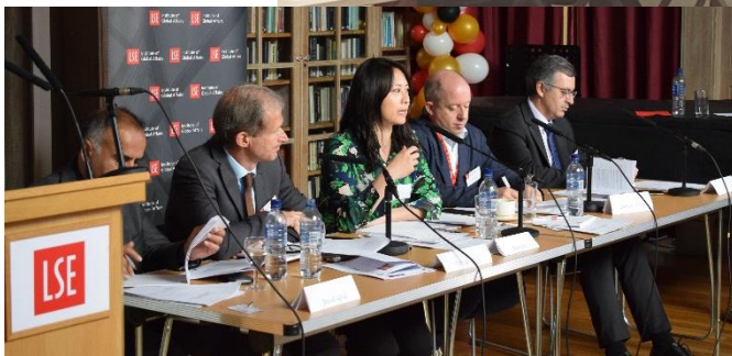
LSE Global Policy Lab launch, May 2017, LSE