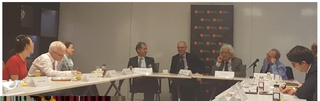
LSE IGA PowerBreakfast Series: 全球领导力——已经默认还是仍需设计?, LSE, October 2017