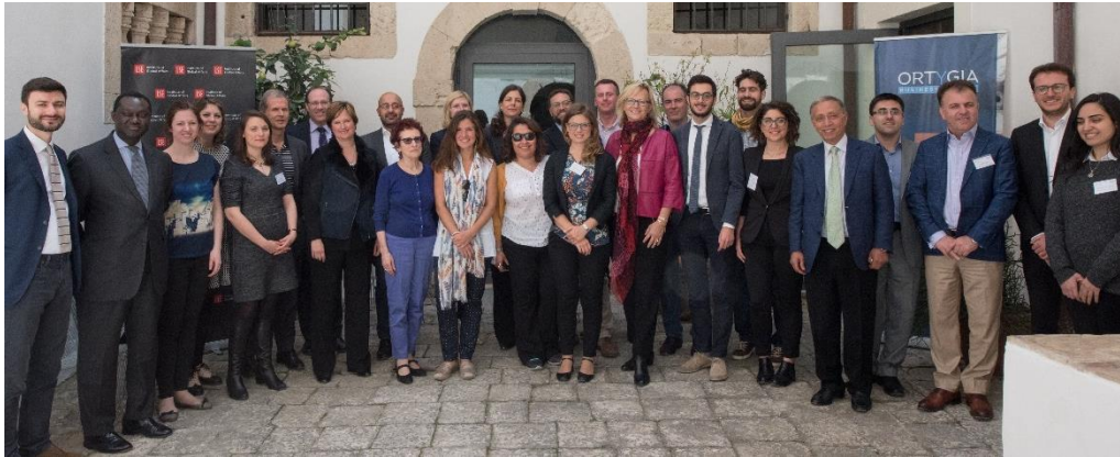
奥提伽岛商学院 (OBS) ——第三届 ALUM 移民研究会议及为 G7 献计, Siracusa, Italy, April 2017